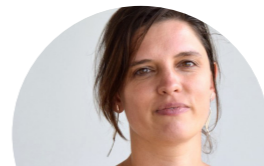
Mitte Schroeven Professionalisering