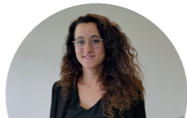
Tine Hoof Onderzoek en professionalisering