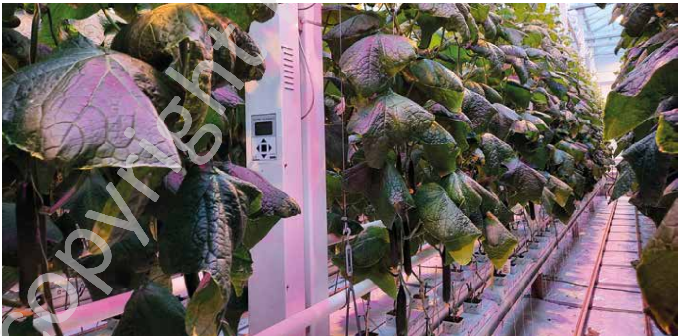
Op een twintigtal bedrijven werd gedurende een periode van veertien dagen een MacView Greenhouse Gas Analyser geïnstalleerd om de concentratie van CO 2 , NO, NO 2 , ethyleen en CO op te volgen.

In dit project trachten we het antwoord te vinden op de vraag vanaf welke waarde een bepaalde concentratie van een gas schadelijk is. Vooral ethyleen en NO x (soms van NO en NO 2 ) moeten als potentieel schadelijke rookgassen nauw worden opgevolgd. De impact die deze gassen hebben op de plant, verloopt