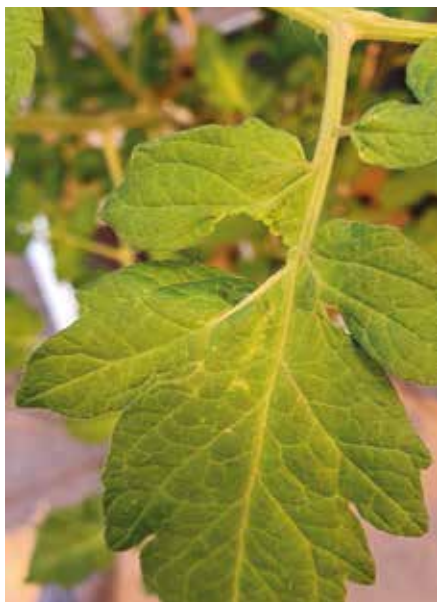
Schadebeeld van \text{NO}_x : verminderd chlorofylgehalte en bijgevolg lagere fotosynthese-activiteit.

zien van de ethyleen-en \text{NO} -concentratie in de tweede periode. Doseren vanuit de ketel biedt dus geen garantie op een betere luchtkwaliteit in de serre.